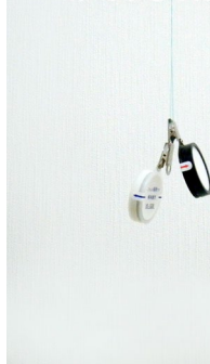
糸で吊るした場合